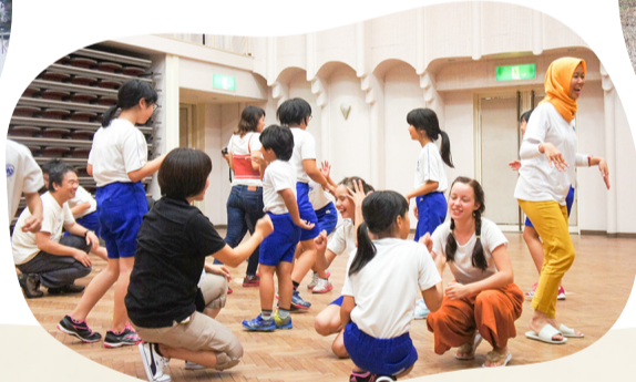
国際ワークキャンプ 外国の遊びで盛り上がる