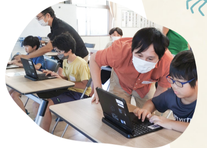
夏休みにはプログラミング教室開催