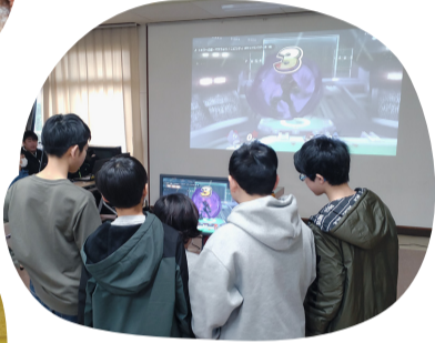
他地域の子どもたちと eスポーツで交流