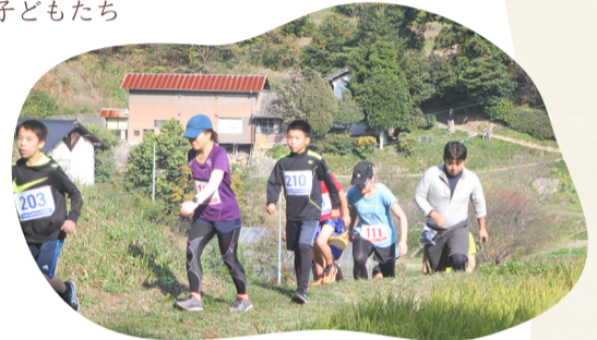
伊野の野山を走るトレイルラン大会