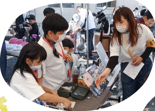
子どもが作ったものを 子どもが売るマーケット