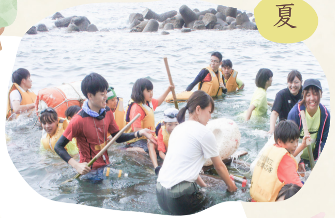
イカダを作って日本海にこぎ出す