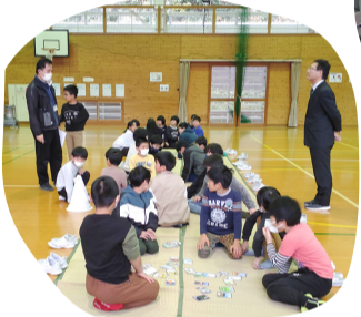
ふるさとカルタ大会で地域を知る