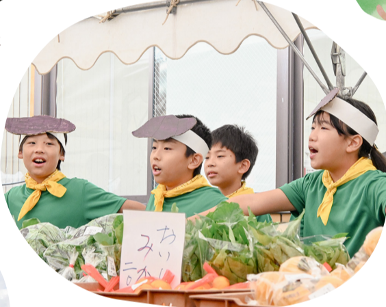
産直市でスタッフとして働く子どもたち