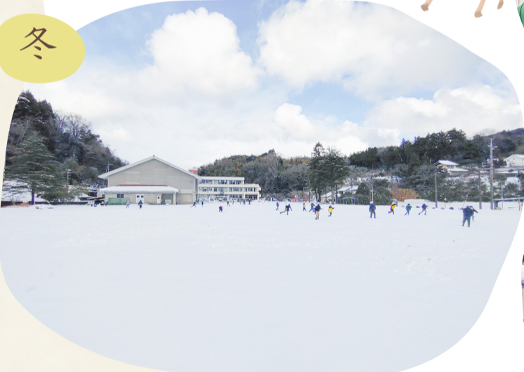
雪合戦に大はしゃぎの小学生