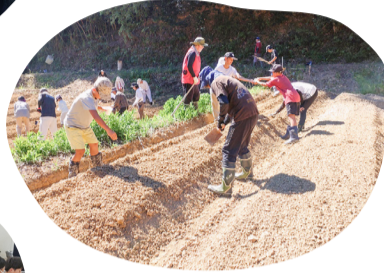
耕作放棄地復活プロジェクト ソバの種まきをする子どもたち