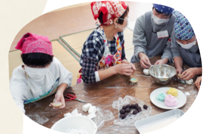
ひな祭りの伝統食 えがもちを作る