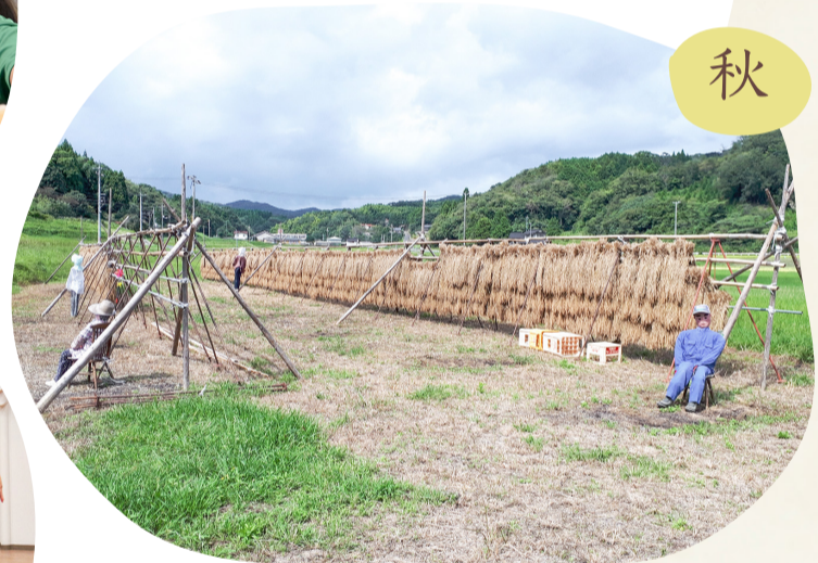
はで干し米の番をする案山子