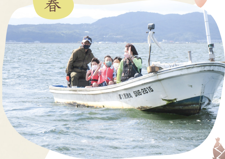
漁師さんから宍道湖について学ぶ