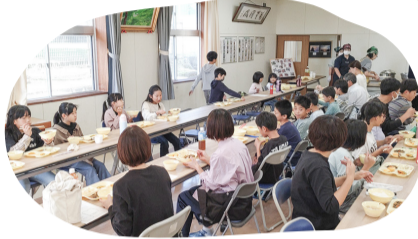
5人のシェフが交替で 腕をふるう子ども食堂