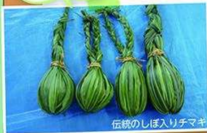
伝統のしぼ入りチマキ