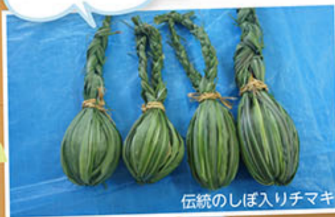
伝統のしぼ入りチマキ